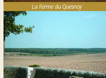
Bois d'Adinfer vu depuis le cimetière militaire de la Ferme du Quesnoy