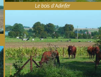
Elevage bovin aubracs et holsteins