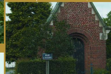
Chapelle de Bucquoy