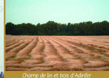
Champ de lin et bois d'Adinfer