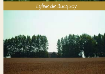
La Ferme du Quesnoy