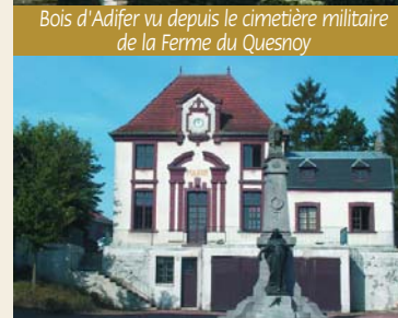
Mairie de Bucquoy et Monument aux Morts