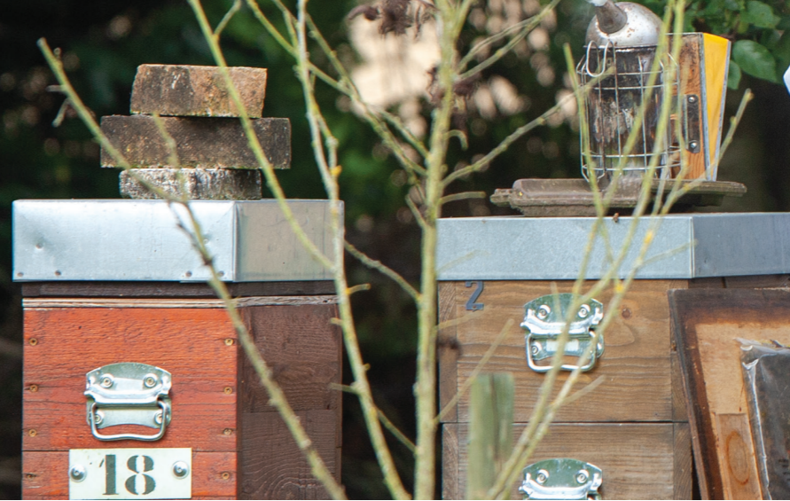
Christophe Ambar et son enfumoir : cet outil permet d'apaiser les abeilles lorsque l'on ouvre la ruche.