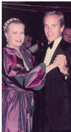
La princesse Grace de Monaco et le Prince Albert à bord du célèbre voilier le Mermoz.