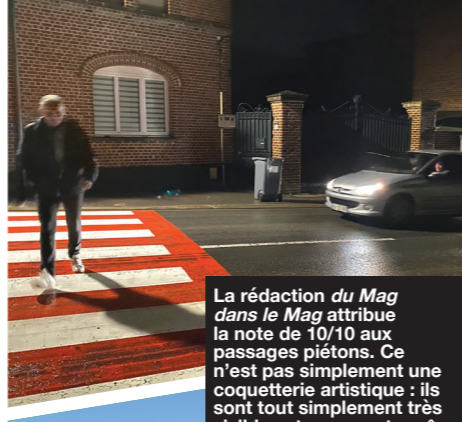
La rédaction du Mag dans le Mag attribue la note de 10/10 aux passages piétons. Ce n'est pas simplement une coquetterie artistique : ils sont tout simplement très visibles et rassurants grâce à cette touche de rouge. Une excellente initiative !