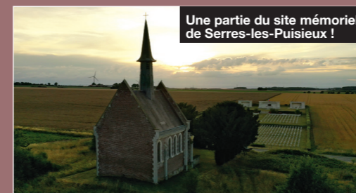
Une partie du site mémoriel de Serres-les-Puisieux !